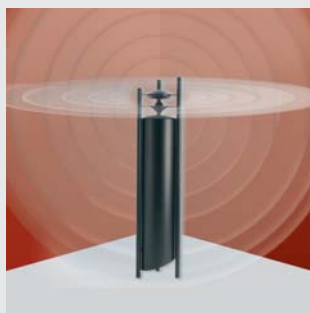
Schallwellen werden kugelförmig und dreidimensional ausgegeben, so dass ein völlig neues Klangbild entsteht.